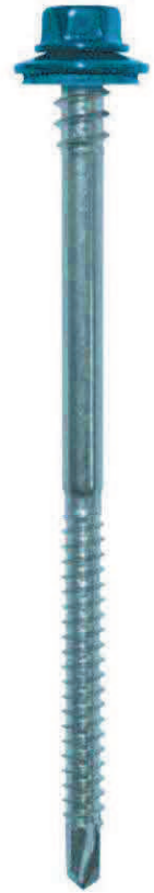
Vis montée avec rondelle NATURELLE